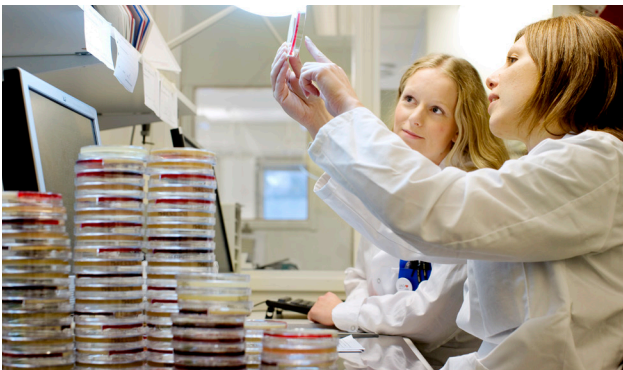
Avd. för Klinisk mikrobiologi, Unilabs, Skövde.