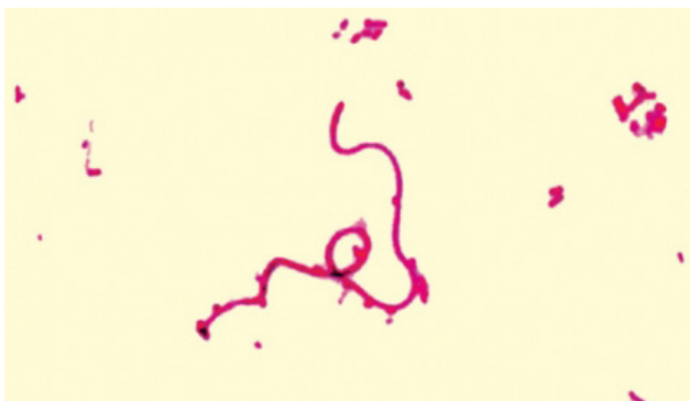
Gramfärgning av Fusobacterium necrophorum

I en amerikansk studie på 312 patienter i åldersgruppen 15-30 år som sökte med faryngitsymtom hittades F. necrophorum med PCR teknik hos 20,5%, jämfört med 9,4% hos 180 asymtomatiska individer i samma åldersgrupp. Motsvarande siffror för Grupp A streptokocker (GAS) var 10,3% resp. 1,1%. För Grupp C och G streptokocker var siffrorna 9,0% hos patienterna och 3,9% hos asymtomatiska. Med ökad poängscore i Centor-kriterier ökade förekomsten av dessa bakteriella patogener.